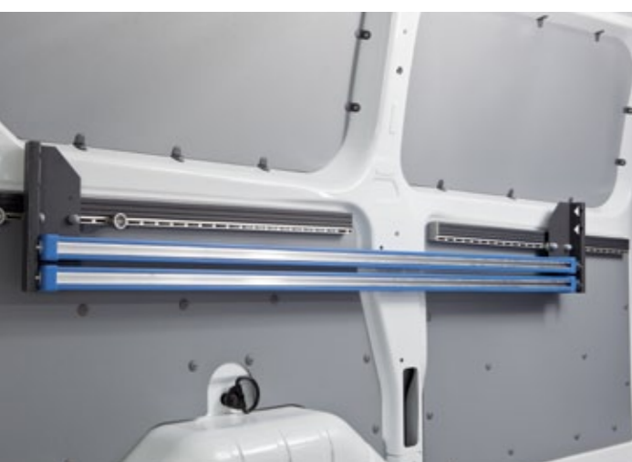
ProSafe Verzurrstange inkl. Spannstangen-Aufbewahrung

Die Spannstangen können horizontal in die Verzurrstangen eingebracht werden, um Ladung sicher zu arretieren. Durch ihre quadratische Form bieten sie optimalen Halt. Außerdem können in das integrierte Schienenprofil Zurrgurte und Zurrgurttittings eingesetzt werden. Ideal sind Spannstangen bei dem Transport von großer und sperriger Ladung.