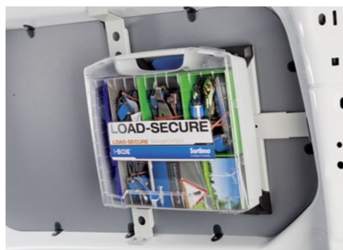
i-BOXX 72 mit Wandhalter