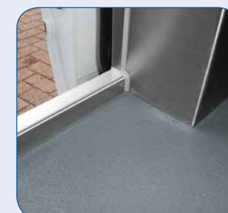
Aufkantung Ladekante (Fischausführung)