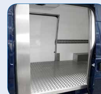
Schiebetür links bei jedem Fahrzeug möglich