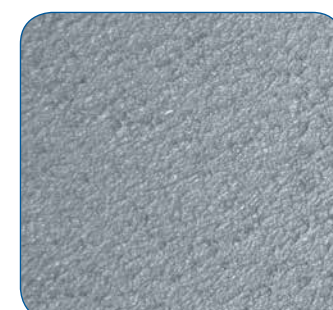
Kunstharzboden (rutschfest und langlebig)