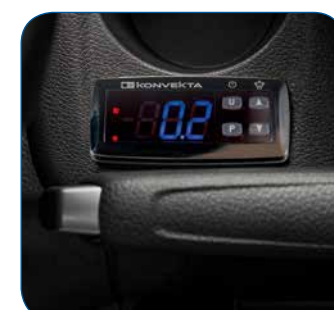
Fernbedienung mit Temperaturanzeige im Fahrerhaus