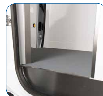
Empfindliche Stellen im Schiebetürenbereich werden durch Edelstahlprofile geschützt