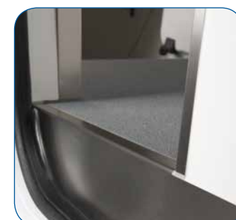
Bündige Abschlusskanten aus Edelstahl