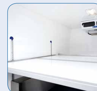
Zwischenböden aus GFK oder Aluminium – herausnehmbar, höhenverstellbar oder fest montiert