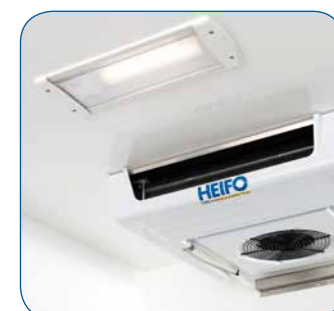
Spritzwassergeschützte Deckenleuchte zur gleichmäßigen Ausleuchtung des Innenraums