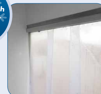
Herausnehmbarer Kälteschutzvorhang (Lamellen) für Heck- oder Seitentür