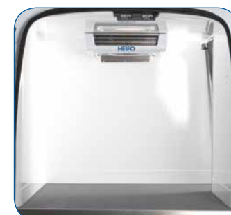
Schlag- und kratzfeste Wände aus glasfaserverstärktem Kunststoff, ohne Radkästen im Laderaum