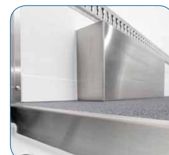
Bündige Abschlusskanten aus Edelstahl