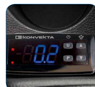
Fernbedienung mit Temperaturanzeige im Fahrerhaus