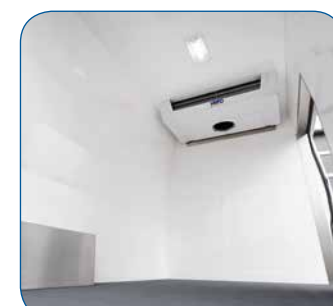
Schlag- und kratz feste Wände aus glasfaserverstärktem Kunststoff