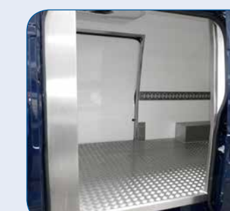
Schiebetür links bei jedem Fahrzeug möglich