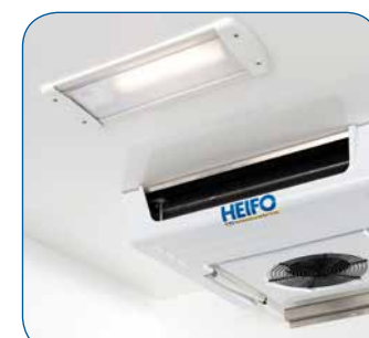
Spritzwassergeschützte Deckenleuchte zur gleichmäßigen Ausleuchtung des Innenraums