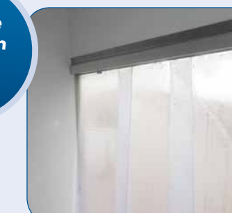
Herausnehmbarer Kälteschutzvorhang (Lamellen) für Heck- oder Seitentür