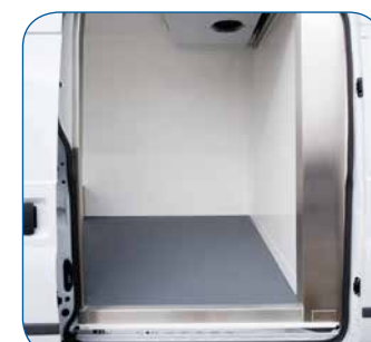
Empfindliche Stellen im Schiebetürenbereich werden durch Edelstahlprofile geschützt