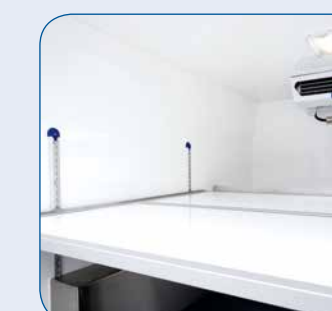
Zwischenböden aus GFK oder Aluminium – herausnehmbar, höhenverstellbar oder fest montiert