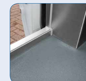
Aufkantung Ladekante (Fischausführung)