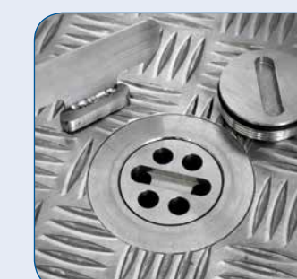
Wasserablauf mit Gewinde-Stopfen aus Edelstahl