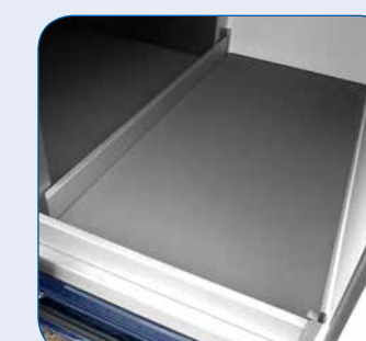
Fangleisten aus Aluminium

Alle Modelle auch als Tiefkühl-Fahrzeuge! -20°C