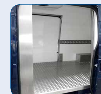
Schiebetür links bei jedem Fahrzeug möglich