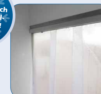
Herausnehmbarer Kälteschutzvorhang (Lamellen) für Heck- oder Seitentür